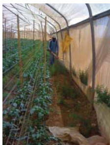
אחת החממות המשתתפות בניסוי של חברת עדן שילד

חברה נוספת היושבת בחממה, עדן שילד, מסיימת בימים אלה פיתוח של חומר הדברה בוטני לא רעיל, המופק מצמחים הגדלים בהרי חברון ובספר המדבר. החומר אפקטיבי ביותר ומרחיק חרקים